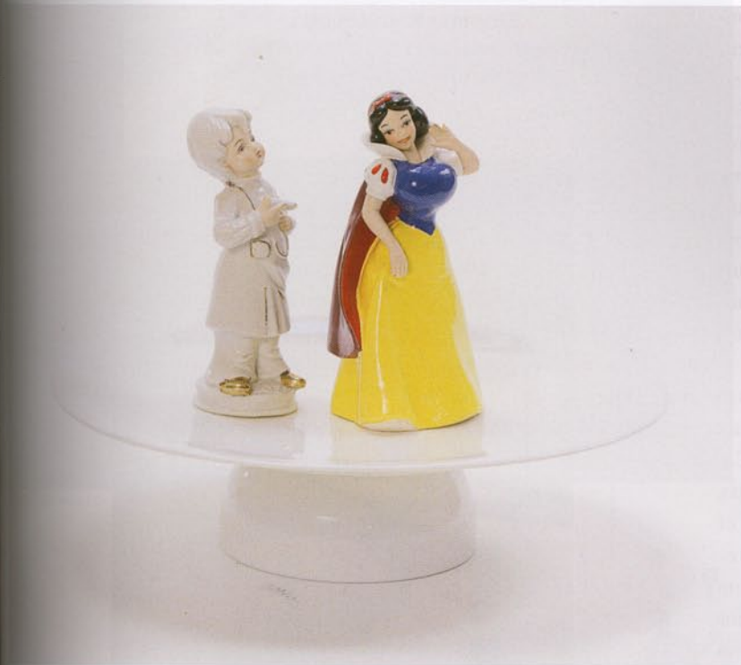
«WHAT UNTIL I GET HOME THEY'RE GOING TO GO CRAZY», 2007