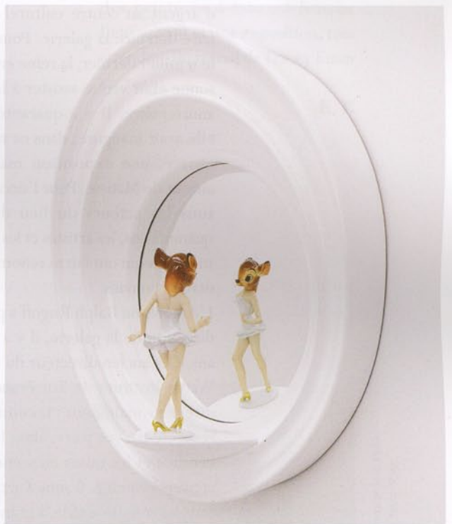
«BAMBI MIRROR», 2007